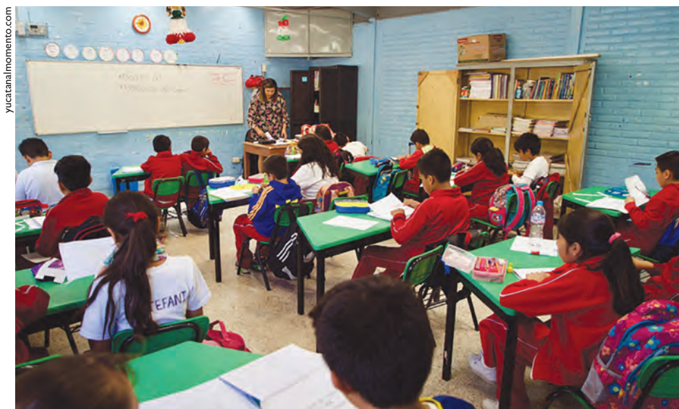
El Programa Escolar de Mejora Continua se presenta como innovación de la Nueva Escuela Mexicana, con un llamado a la colaboración y participación más activa de toda la comunidad escolar

En este sentido, el Programa Escolar de Mejora Continua se presenta ahora como innovación en la gestión, en el modelo de la Nueva Escuela Mexicana, con un llamado a la colaboración y participación más activa de toda la comunidad escolar.