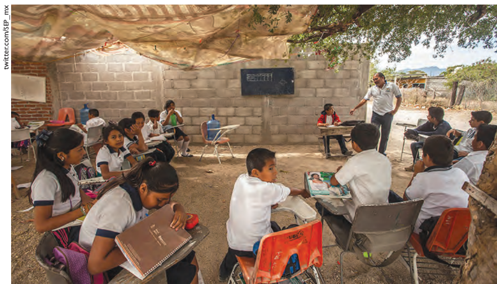
En una sociedad donde existen brechas económicas y culturales, son necesarios los principios que orientan el modelo de la Nueva Escuela Mexicana, para combatir la desigualdad y la discriminación